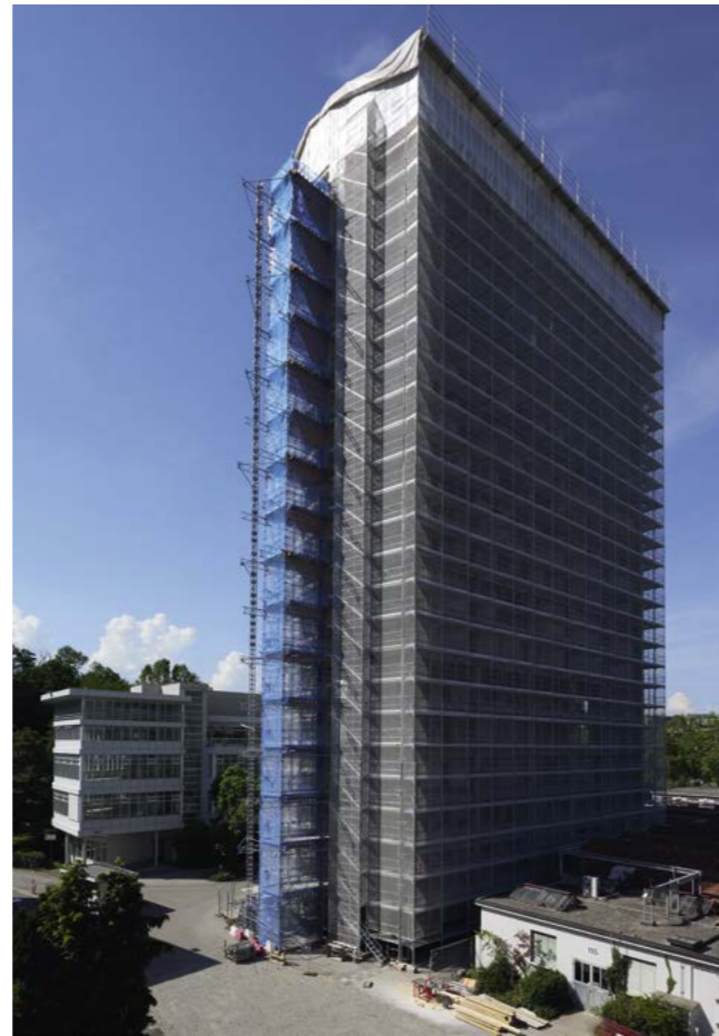
Véritable phare à l'extrémité nord du secteur Praille Acacias Vernets, la tour est entièrement rénovée avec un label de très haute performance énergétique.

Le double bâtiment situé en haut de la pointe, tout au début de la route des Jeunes, fait l'objet d'une rénovation moyenne. On voit par exemple en déambulant dans les étages que les cadres de portes ont été protégés, que les portes et armoires sont stockées pour être si possible réutilisées et que la majorité des cloisons sont maintenues. Le bâtiment, destiné principalement à des services du Département de la cohésion sociale, est en train d'être équipé d'un étage de