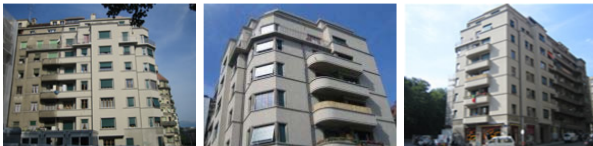
Muller-Brun 1 : façades terminées et échafaudages déposés - mai 2006