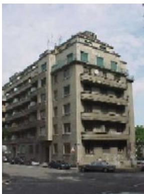
Etat avant les travaux