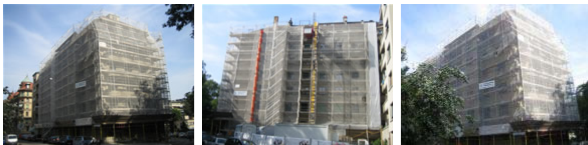
John Rehfoos 9-11 : rénovation des façades en cours - juin 2006