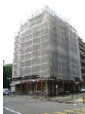
Montage des échafaudages et du monte-charge terminé - août 2005