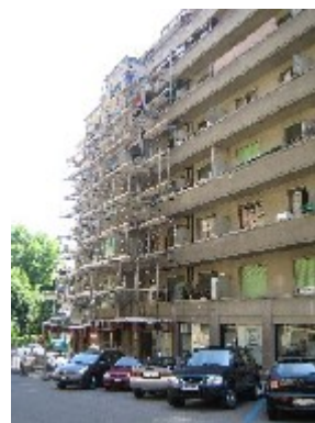
Pose des échafaudages - juillet 2005