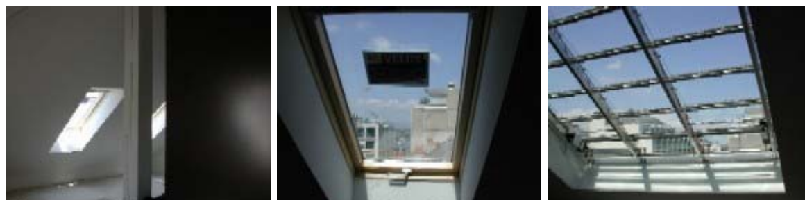
Quelques vues du nouvel appartement au dernier étage