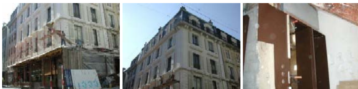
Démontage des échafaudages - juillet 2005 - montage de la cuisine aux combles