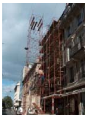
Pose des échafaudages - février 2005