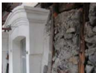
Remise en état de la charpente - avril 2005