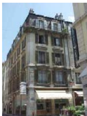
Etat avant les travaux