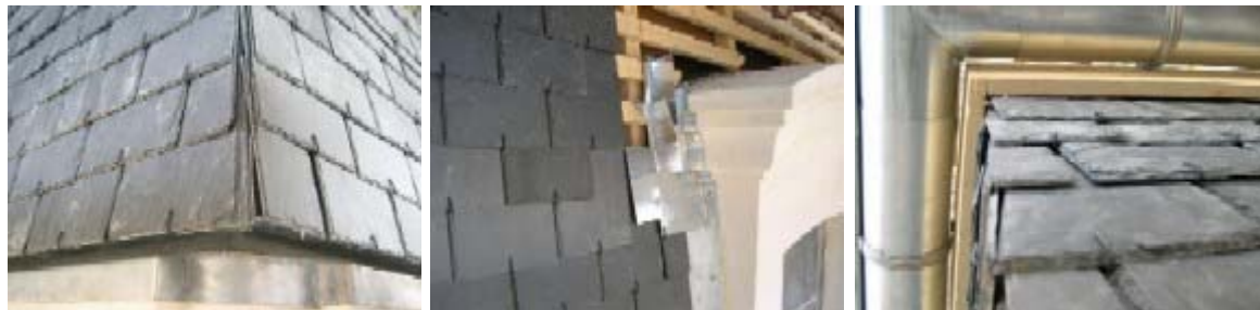
Pose des ardoises - juin 2005