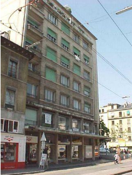
Juin 2008 : état avant travaux