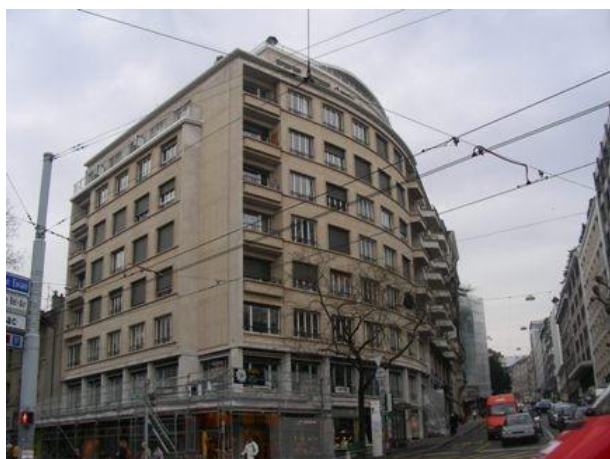
Février 2009 : état des travaux