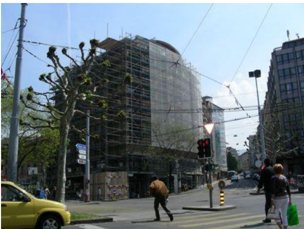
Juin 2008 : mise en place des échafaudages